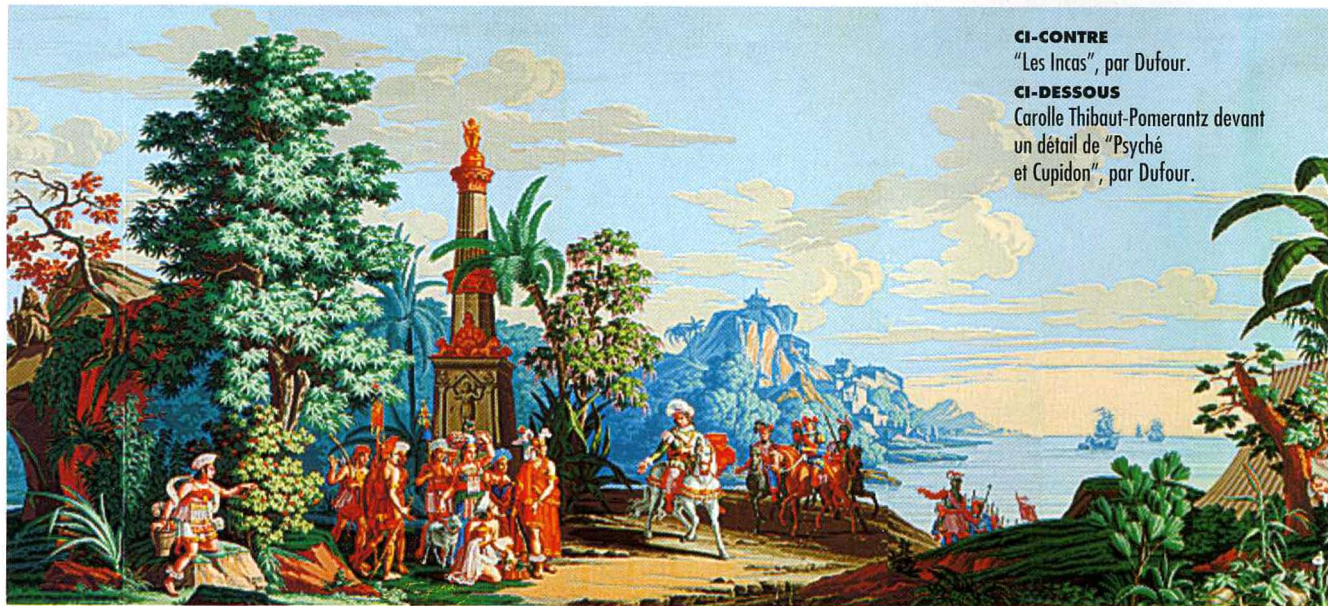
CI-CONTRE "Les Incas", par Dufour.